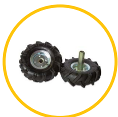
KIT RUOTE TRACTOR