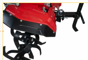
NEW DESIGN Nuovo carter di protezione frese