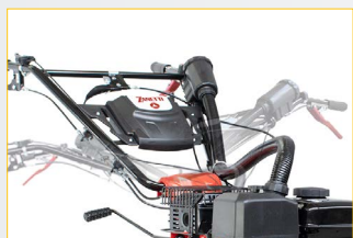
LEVA ESL Easy Shift Lever